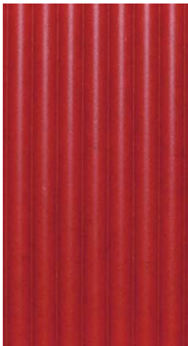
RIVA color | red