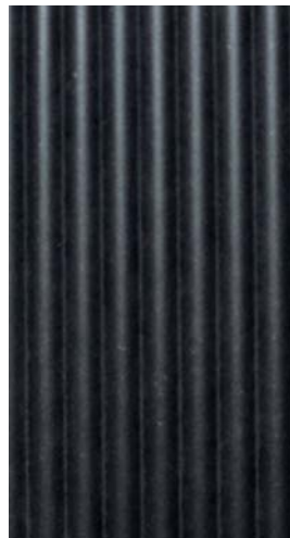
RIVA color | black

Bitte beachten Sie, dass die dargestellten Farben nicht verbindlich sind. Fordern Sie sich bei Bedarf ein Muster an.