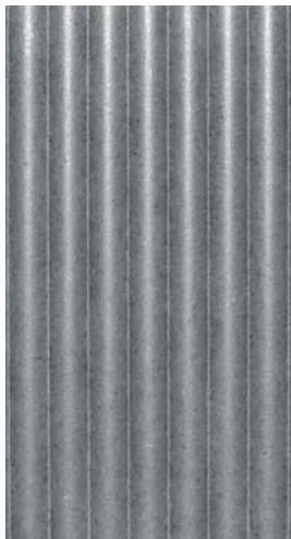
RIVA color | grey