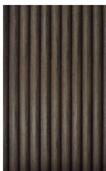
Eiche schoko FINELINE

Die RIVA Riffeloberfläche ist in drei Holzarten, sowie in MDF roh für eigene Farbgestaltung erhältlich. Optional sind die Platten auch mit exklusiver Vintage Lackierung in den Farbtönen gold und silber lieferbar.