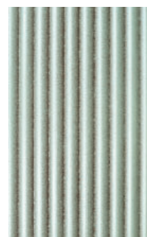
MDF Vintage Silber